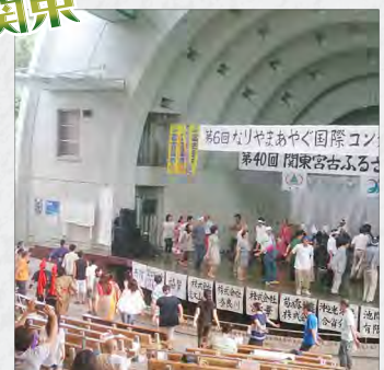
最後はやっぱりクイチャー