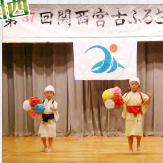
可愛い与那覇ヨンシー