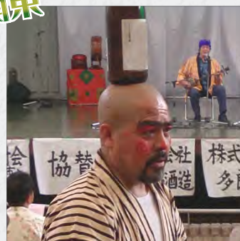
すっかりできあがってますね