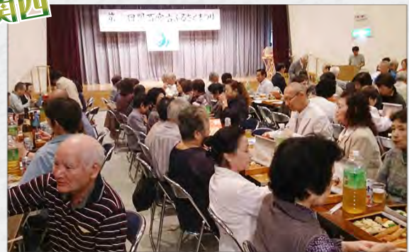
関西は 10/12 に兵庫・尼崎で開催