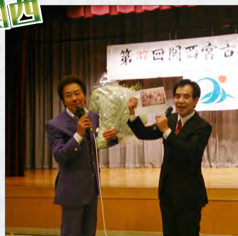
有名人も駆けつけた (歌手・松島アキラ)