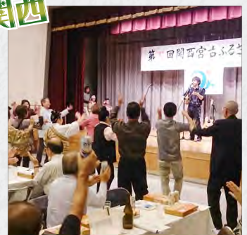
盛り上がりは最高潮 !!