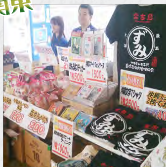
場内で宮古島関連商品も販売